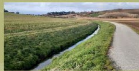
Weidenbach vor Bepflanzungsmaßnahme