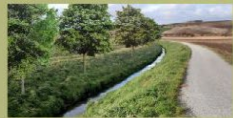
Weidenbach nach Bepflanzungsmaßnahme - Visualisierung